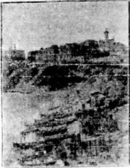
Bărci pescărești la Constanța